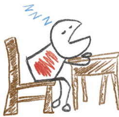
تعب شديد وشحوب