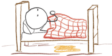
كثرة التبول في الفراش