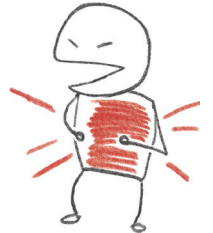
آلام في المعدة / غثيان